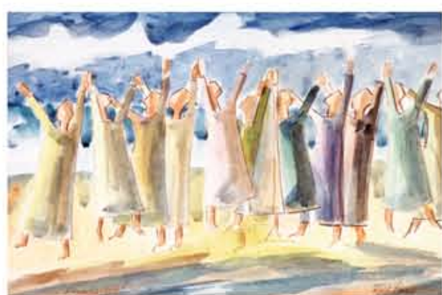
Skiss i akvarell till oljemålningen "Hoppets ljus", 230 x 140 cm. Jämjö församlingshem, Blekinge.