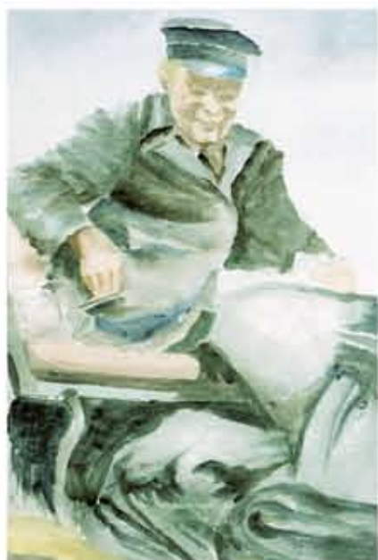
"Kusken", akvarell, 34 x 50,5 cm. Privat ägo.