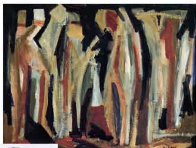
"Det historiska mötet" (presidenterna Bush, Mitterand, Gorbatjov och Brandt), olja på duk, 116 x 89 cm. Vita Huset, Washington. President Bush d.ä. förädrades denna målning i samband med Gulfkrigets slut.