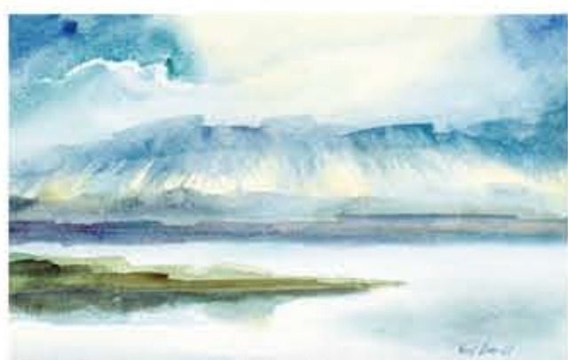
"Uppsprickande molntäcke", akvarell, 52 x 33 cm. Okänd ägare.