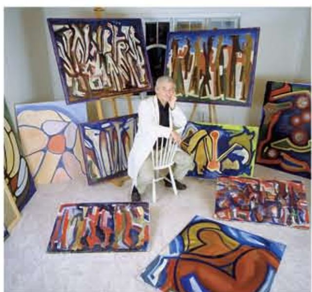
Konstnären själv omgiven av sina expressiva målningar.

"Ledargestalterna" som serigräfi överlämnas till partiledaren Ingvar Carlsson av Arbetarekommunen i Karlskrona i samband med socialdemokraternas 100-årsjubileum.