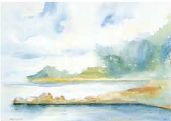
"Efter regn", akvarell, 70 x 52 cm. Svenska kyrkan i New York.